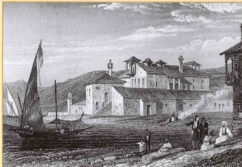
«Το σπίτι του λόρδου Βύρωνα στο Μεσολλόγγι», χαλκογραφία από το έργο του W. Pursel, 1834.